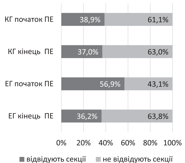
Рис. 2. Кількість дітей, які відвідують заняття у спортивних секціях, %

У результаті відбулися зміни в показниках залученості першокласників до занять у спортивних секціях. Так, на початку педагогічного експерименту кількість дітей, що займаються різними видами спорту, була незначною, проте однаковою у контрольній (37,0%) та експериментальній (36,2%) групах. Наприкінці навчального року в результаті впливу експериментального чинника уже 56,9% учнів експериментальної групи займалися в спортивних секціях (рис. 2).