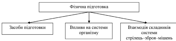
Рис. 1. Особливості фізичної підготовки

Ураховуючи специфіку виконання спортсменами влучного пострілу у стрільбі з пістолета важливо зауважити, що фізична підготовка впливає на взаємодію складників системи стрілець-зброя-мішень. Вдало дібрані засоби допомагають уникнути розосередженості у виконанні технічних елементів і згодом сприяють до більш злагодженій роботі складників системи стрілець-зброя-мішень (рис. 1).