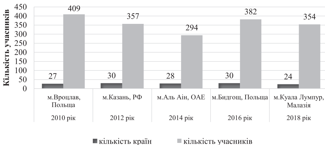
Рис. 2. Кількість країн та спортсменів, які брали участь у чемпіонатах світу серед студентів в період 2010–2018 років

На рис. 3 зображено зміну програм проведення чемпіонату світу серед студентів. Установлено значне зростання кількості стрілецьких вправ для чоловіків і значне зменшення для жінок у 2012 році. У 2016 році збільшено кількість вправ для чоловіків. У 2018 році кількість вправ суттєво зменшилася для чоловіків та жінок (7 вправ для чоловіків і 6 вправ для жінок). На міжнародних студентських змаганнях зі стрілецьких видів спорту – кількість вправ стала «провальною», так чоловіки виконували 7, а жінки – 6 програм змагальної діяльності.