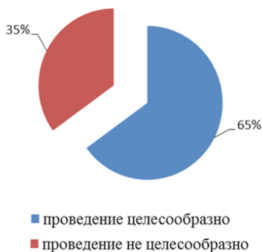
Рис. 1. Целесообразность проведения юношеских Олимпийских игр (по мнению специалистов, n=27)

атлета. При этом проблема заключается в том, что большая часть спортсменов рассматривают Игры, в первую очередь, как спортивное мероприятие.