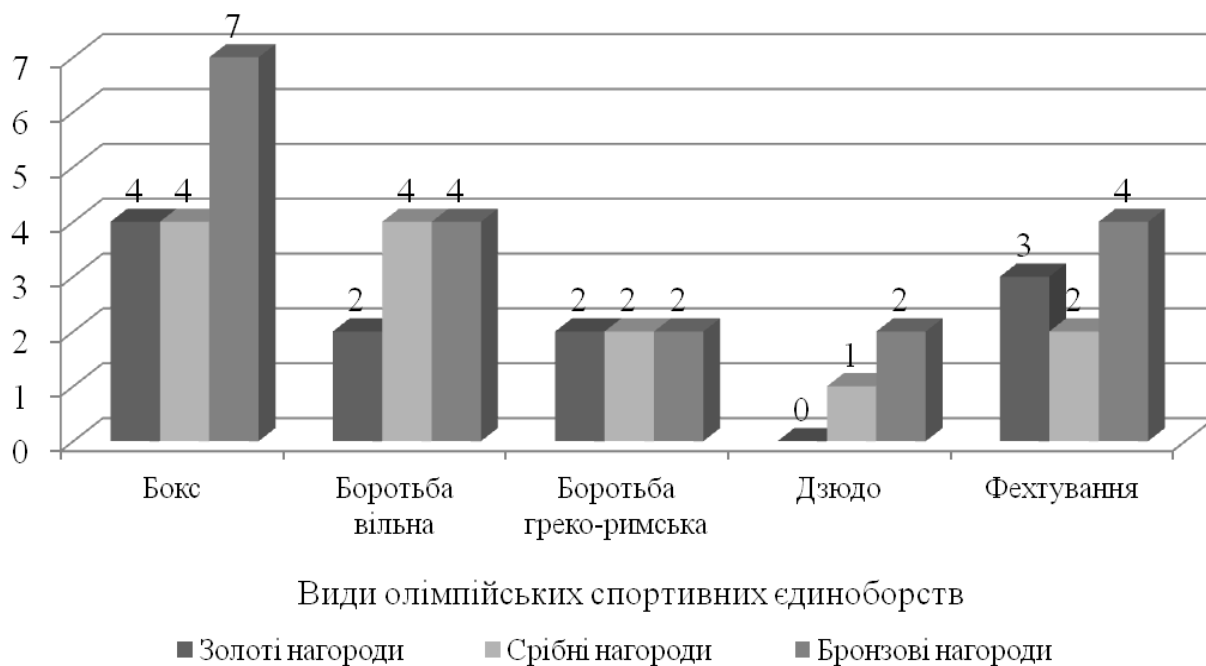
Рис. 3. Розподіл олімпійських нагород представників України (1992–2016 рр.) за видами спортивних єдиноборств

Найбільш варіативні здобутки серед бронзових медалістів. Розподіл за абсолютними значеннями становить від семи нагород у боксі до двох нагород у боротьбі греко-римській та дзюдо. При цьому спортсмени у боротьбі вільній та фехтуванні здобули по чотири бронзові нагороди.