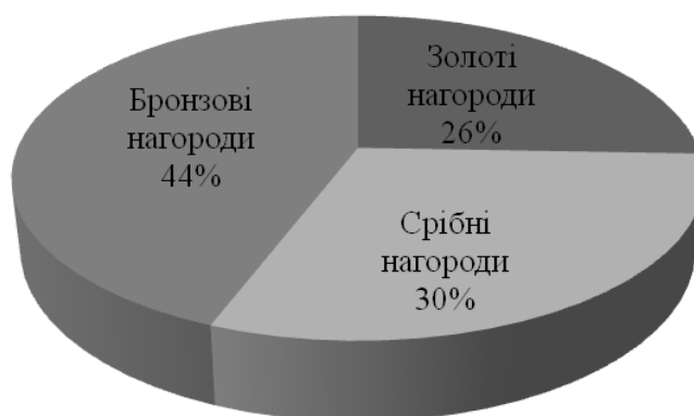
Рис. 1. Співвідношення олімпійських нагород представників України (1992–2016 рр.), здобутих зі спортивних єдиноборств

Узагальнення отриманих даних дало нам підстави визначити співвідношення нагород, які отримали спортсмени України на змаганнях зі спортивних єдиноборств на Іграх Олімпіад упродовж 1992–2016 років. Установлено наявність приблизно однакової кількості нагород найвищого гатунку та срібних нагород, які отримали наші спортсмени незалежно від виду спортивного єдиноборства (рис. 1). Проте фактично зберігається пропорційність щодо найменшої частки золотих нагород (26%, тобто 11 нагород), дещо більшої частки срібних нагород (30%, тобто 13 нагород).